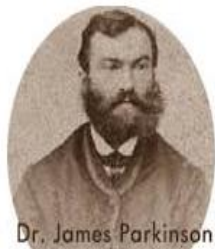
Dr. James Parkinson

El médico británico James Parkinson fue el primero en describir la enfermedad en 1817, llevando así el apellido de su descubridor